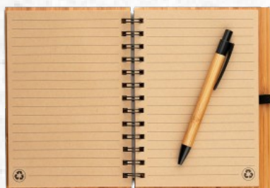
93485 DICKENS A5. Caderno A5