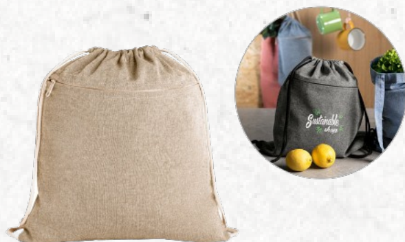
92928 CHANCERY. Sacola tipo mochila (140 g/m 2 )