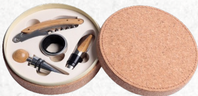
KV0130 Kit Vinho 5 peças