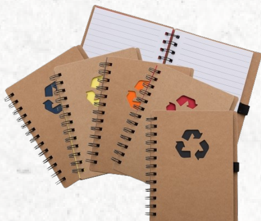
12000 Bloco de Anotações Ecológico