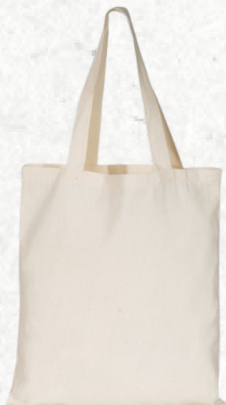
13803 Sacola de Algodão