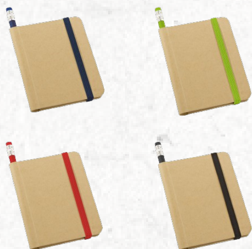
93422 BRONTE. Caderno A7