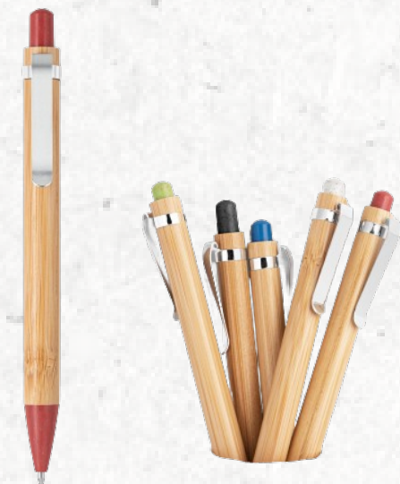
81014 VOLTER. Esferográfica