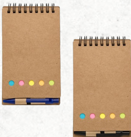
12244 Bloco de Anotações com Caneta e Autoadesivo