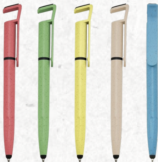
00708T Caneta Fibra de Bambu Touch com Suporte