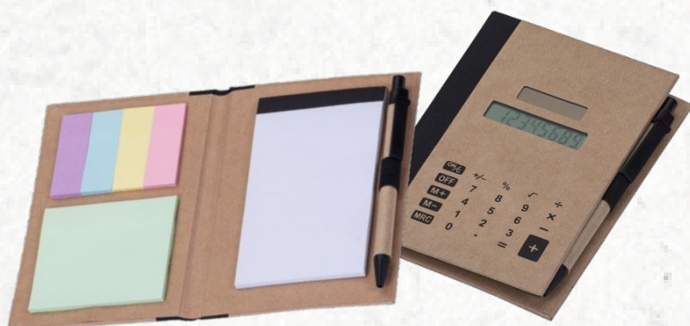
12737 Bloco de Anotações com Autoadesivos e Calculadora