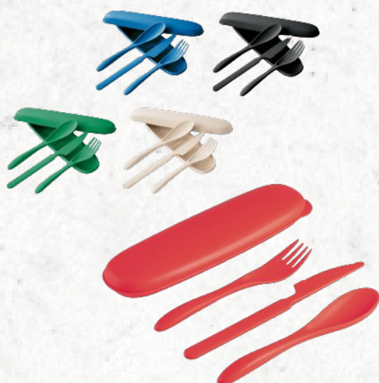
94055 TAHINI. Conjunto de talheres