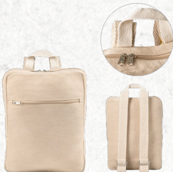
92938 MARBELLA. Mochila em juco