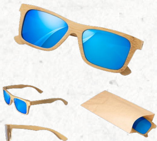
98140 SANIBEL. Óculos de sol em bambu