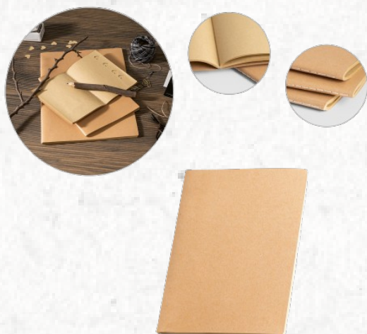
93273 ALCOTT A5. Caderno A5 com capa em cartão (250 g/m 2 )