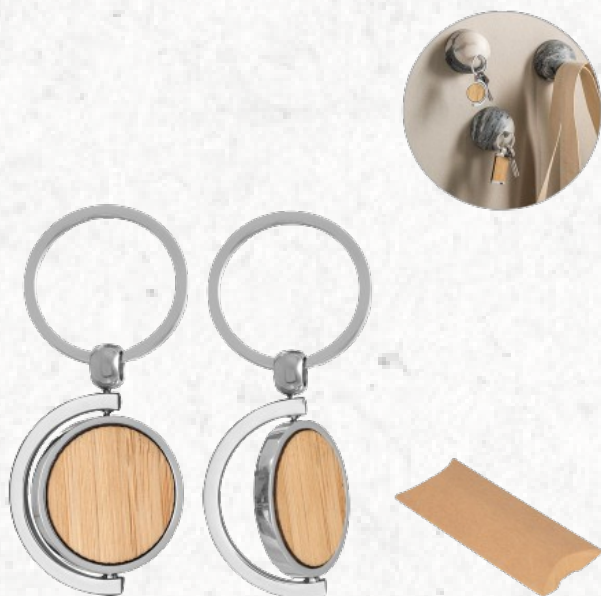
95071 HOMER ROUND. Chaveiro redondo