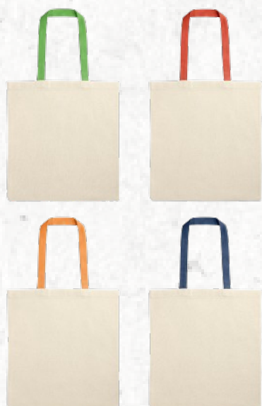
92826 KOLONAKI. Sacola