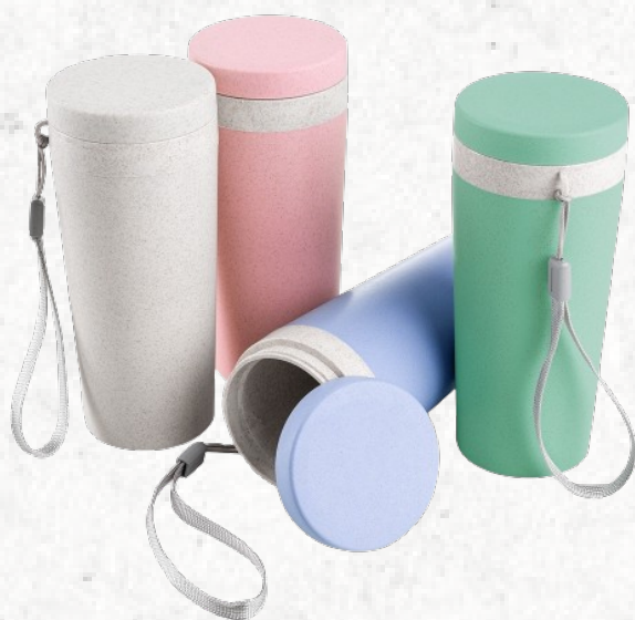
03006 Copo Fibra de Bambu 350ml