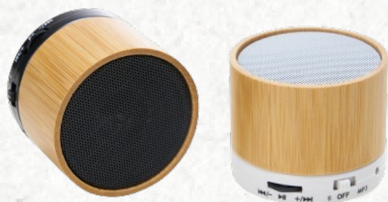
04361 Caixa de Som Multimídia Bambu