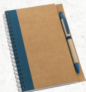
93715 ASIMOV. Caderno B6 espiral com folhas lisas