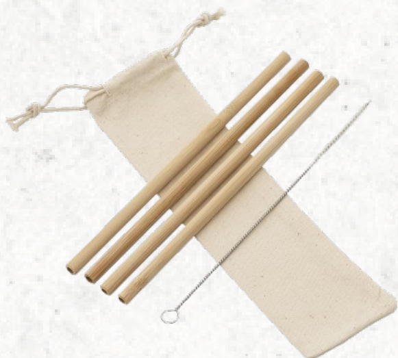
14597 Kit Canudos de Bambu com Escova de Limpeza