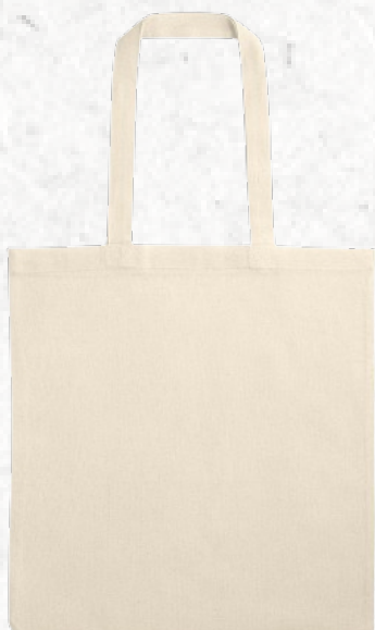
92821 BONDÍ. Sacola (140 g/m 2 )