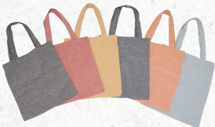
14962 Sacola de Algodão