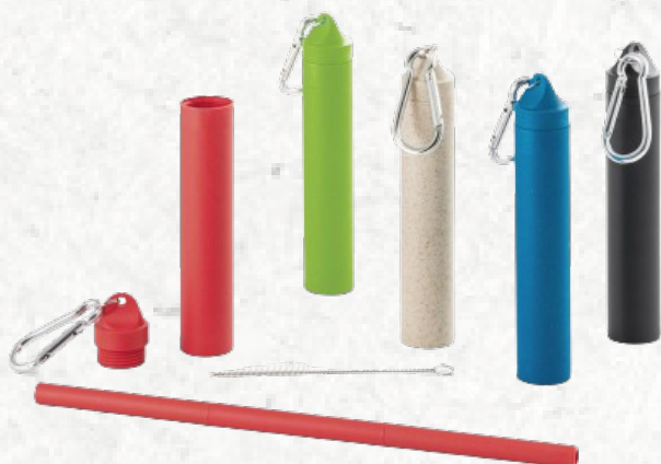
94056 LYNNE. Conjunto de canudo