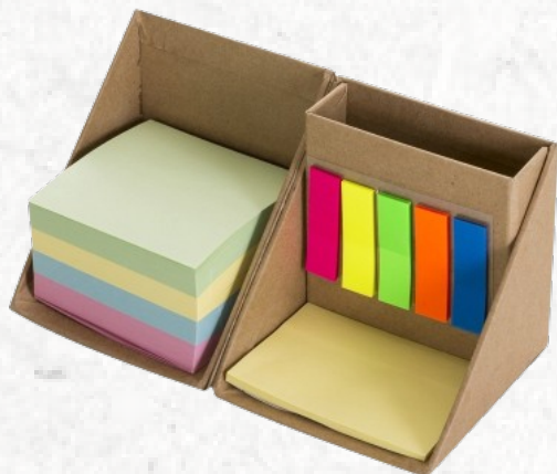
12516 Bloco de Anotações Cubo