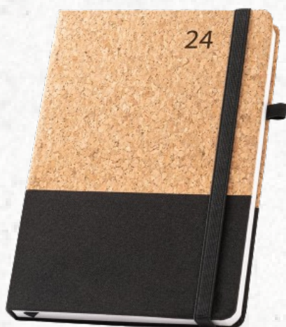
66199 - QUENTAL A5. Agenda em cortiça e linho