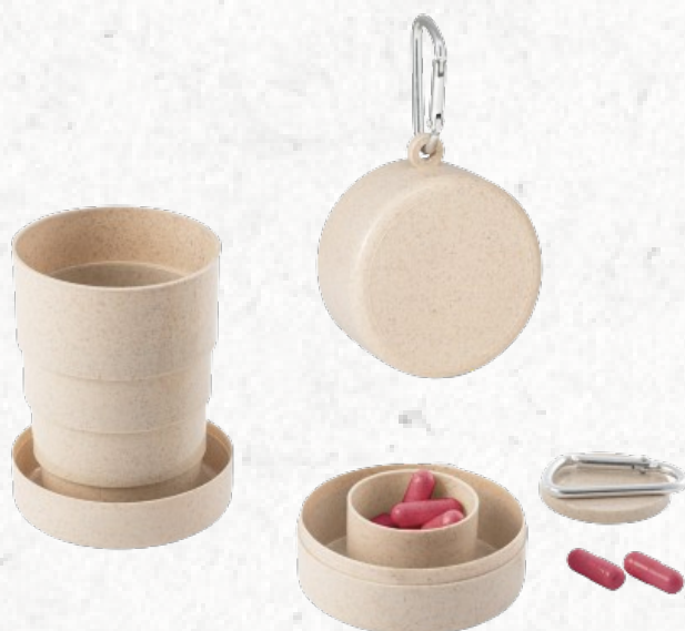
94769 NADAL. Copo de viagem retrátil 210 mL