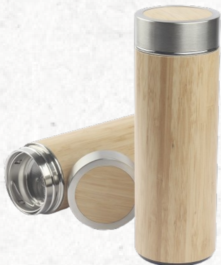
GA6800 Garrafa Térmica