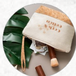
92735 BLANCHETT. Bolsa de cosméticos