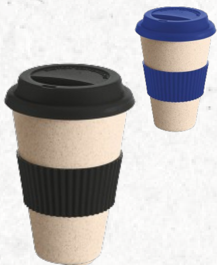
94626 CINNAMON. Copo para viagem