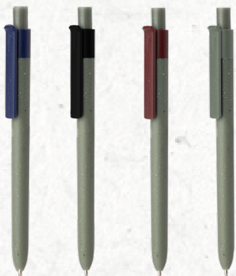
CP0209 Caneta Plástica Caneta produzida com corpo de caixa de leite reciclada