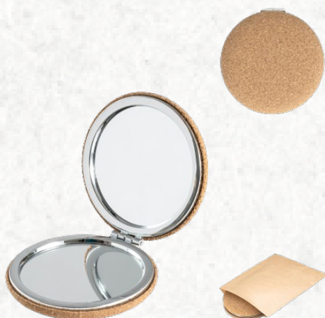
94898 TILBURY. Espelho