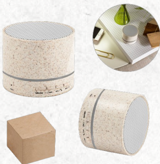
57930 GALOIS. Caixa de som portátil com microfone