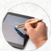
91770 ZOLA. Esferográfica em bambu