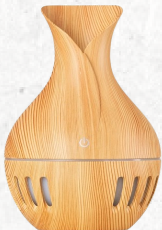
14488 Umidificador Ultrassônico com Led