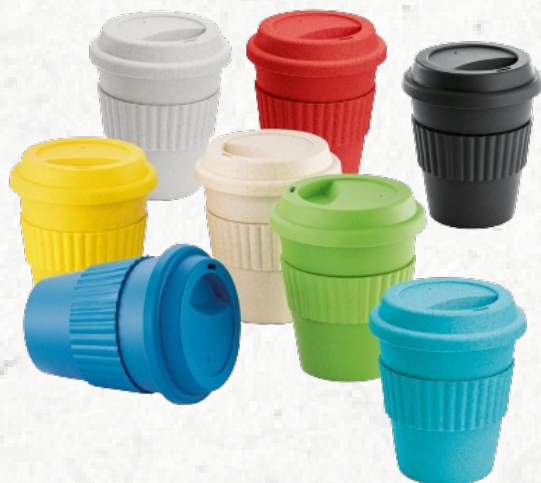
94058 CUPPA. Copo de viagem