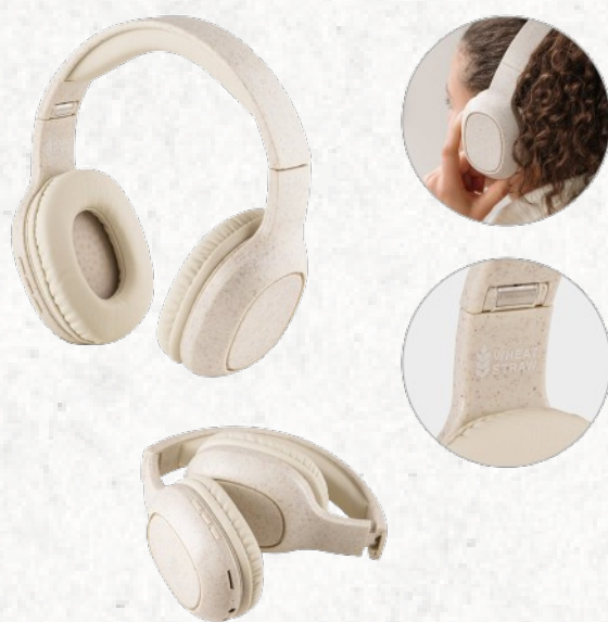
57939 MARCONI. Fones de ouvido wireless dobráveis