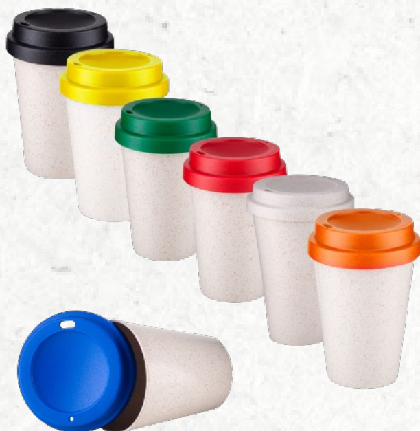
CO8930 Copo Fibra de Arroz