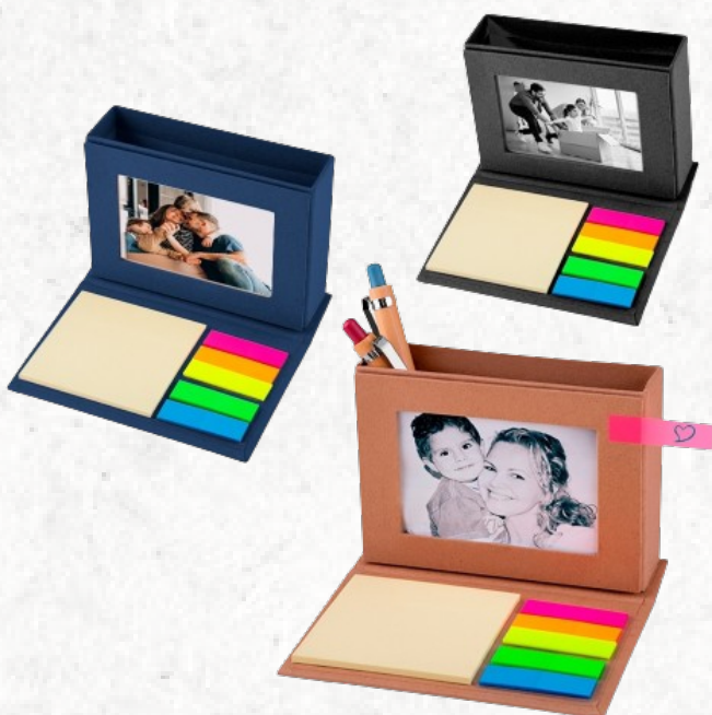
14689 Bloco de Anotações Ecológico