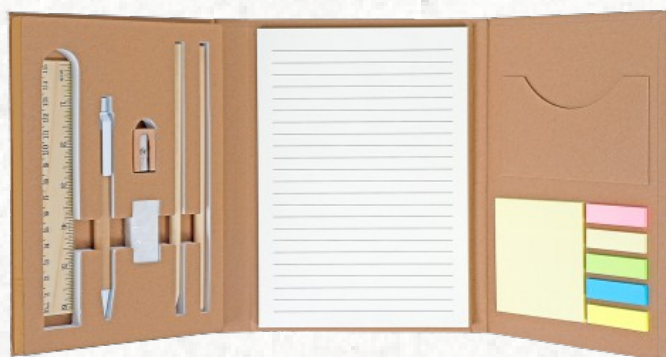
CJ40035 Kit Escritório