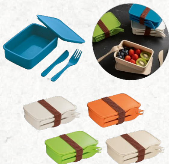
94053 CANOLA. Marmita