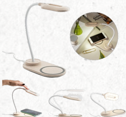
58517 LEZZO. Luminária de mesa com carregador wireless