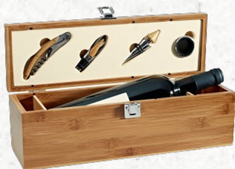
94189 SYRAH. Conjunto para vinho