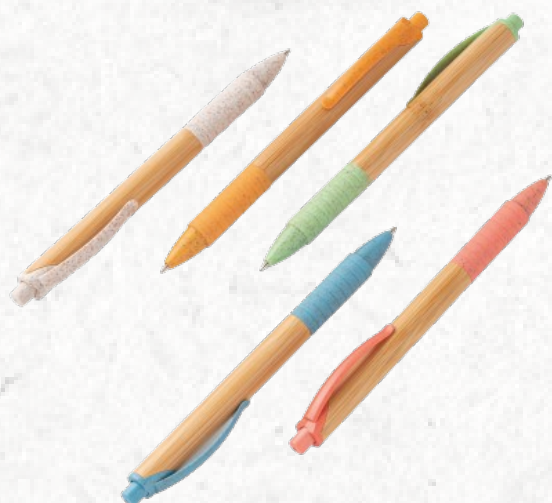
81013 KUMA. Esferográfica