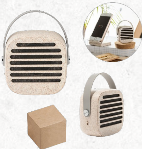
57936 PIYON. Caixa de som portátil