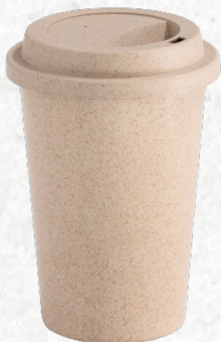
94636 TISANA. Copo para viagem