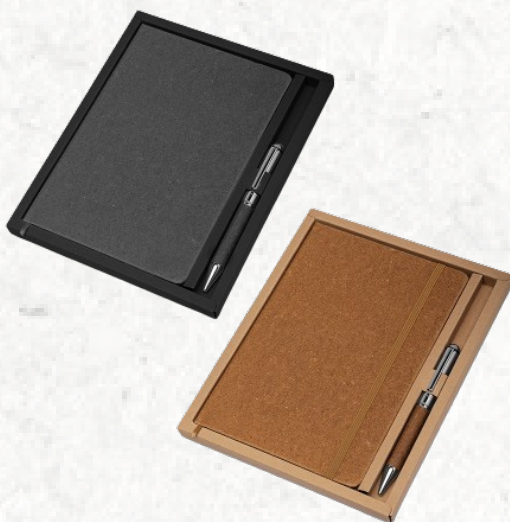
CAD180 Kit caderno de anotações e caneta metálica