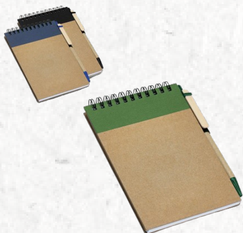
93427 RINGORD. Caderno de bolso espiral com folhas lisas