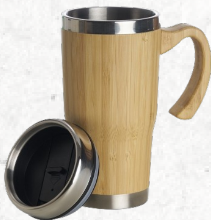
18643 Caneca Bambu 500ml