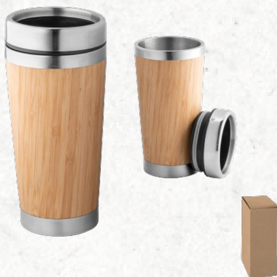
94241 PIETRO. Copo de viagem (térmico)