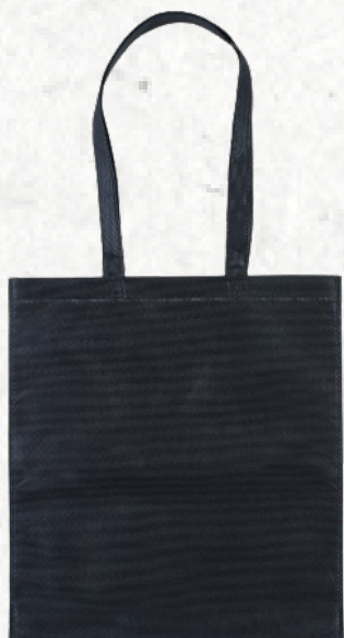
13780 Sacola TNT com Alça