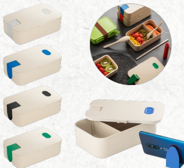
94051 ALSI. Marmita