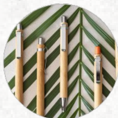
81163 HERA. Esferográfica