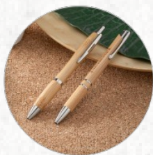
81011 BETA BAMBOO. Esferográfica