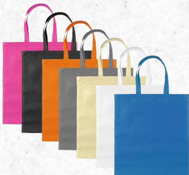
13780N Sacola de TNT