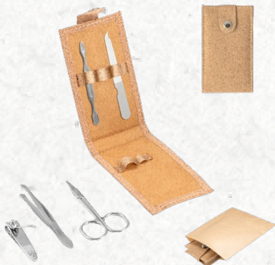
94897 ZENA. Conjunto de manicure