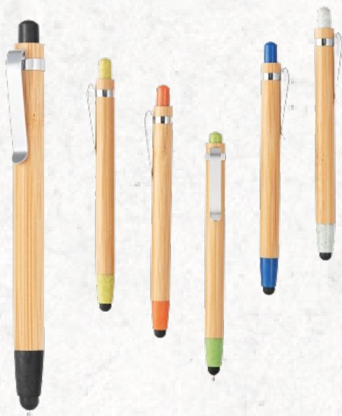
81012 BENJAMIN. Esferográfica