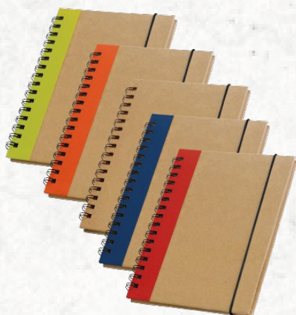
93428 CORNISH. Caderno capa dura